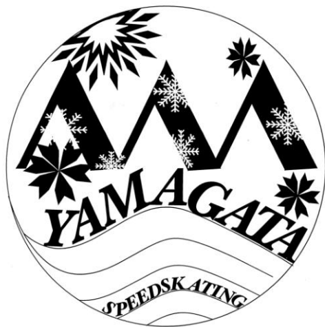
山形県立東根工業高等学校校 3年 菊地 由輝