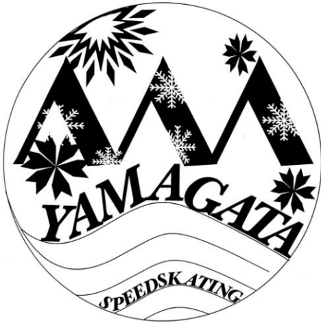
山形県立東根工業高等学校校 3年 菊地 由輝